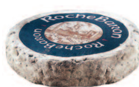
Rochebaron 580 g