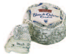
Ferme de la Tremblaye Chèvre bleu 150 g