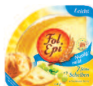
Fol Épi Allégé tranches 150 g