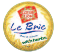
Coeur de Lion Brie herbes 1 kg