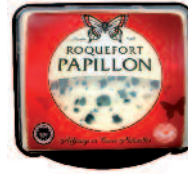
Papillon Roquefort Tranche 125 g