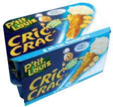
P'tit Louis Cric Crac 125 g