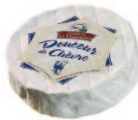
Ferme de la Tremblaye Douceur Chèvre 400 g