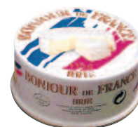
Bonjour de France Brie 125 g