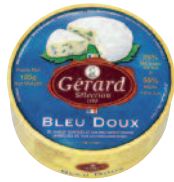
Gérard sélection Bleu doux 125 g