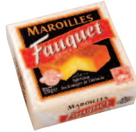
Fauquet Maroilles 750 g