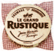
Le Rustique Brie 1 kg