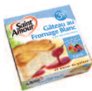
St Amour Gâteau Léger Fr Blanc 350 g