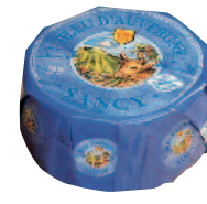
Sancy Bleu d'Auvergne 2,6 kg