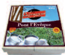
Levasseur Pont l'Evêque 180/240/400 g