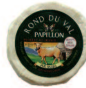
Papillon Rond du Val 150 g