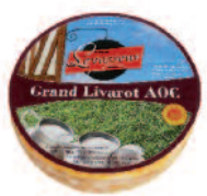
Levasseur Grand Livarot 1,350 g