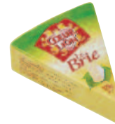
Coeur de Lion Brie pointe 125 g