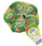
Gérard Mini filet 125 g