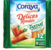
Coraya Délices Roulé Tartare 180 g