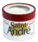
St André 200 g