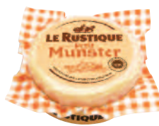
Le Rustique Munster 200 g