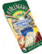
Il Villaggio Gorgonzola 150 g