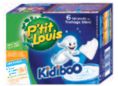
P'tit Louis Kidiboo Nature 120 g