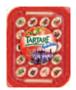
Tartare Aperifrais Italie 100 g