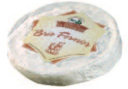
Ferme de la Tremblaye Brie fermier 1 kg