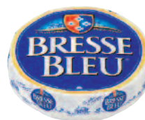
Bresse Bleu 2 kg