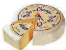
Belle des Champs 2 kg