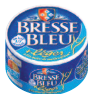
Bresse Bleu Léger 200 g