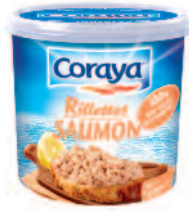
Coraya rillettes Saumon 150 g