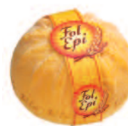
Fol Épi 3 kg