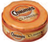
Chaumes 200 g