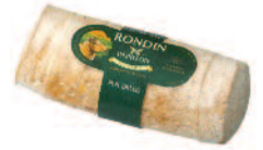
Papillon Rondin 800 g