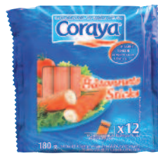
Coraya Bâtonnets sticks 180 g