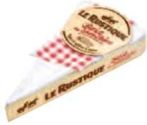
Le Rustique Brie pointe 200 g