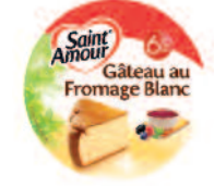
St Amour Nature 3 kg