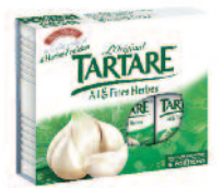
Tartare Ail & Fines Herbes 100 g