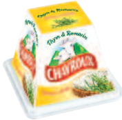
Chavroux Thym-Romarin 150 g