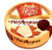
Cœur de Lion Pié d'Anglois 200 g