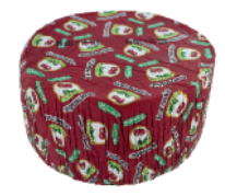
Rambol Gourmandise Kirsch 2 kg