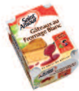
St Amour Gâteau Fromage Blanc 70 g