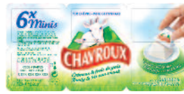
Chavroux portions 120 g