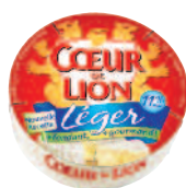
Coeur de Lion Camembert Léger 250 g