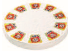
Coeur de Lion Brie 3/1 kg