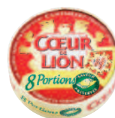
Coeur de Lion Camembert 8 port 240 g