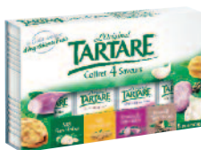
Tartare Coffret 4 Saveurs 133 g