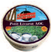
Levasseur Livarot 270 g