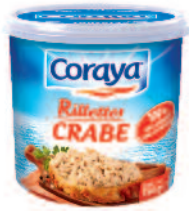
Coraya rillettes Crabe 150 g