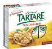
Tartare Noix croquantes 100 g