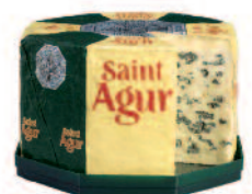
St Agur 2,3 kg