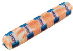
Coraya roulé 2 kg