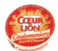
Coeur de Lion Coulommiers 350 g