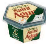
St Agur Crème de 150 g