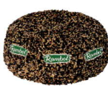
Rambol Décoré Poivre 1,2 kg