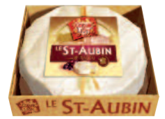
Cœur de Lion St-Aubin 200 g