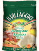
Il Villaggio Parmigiano rapé 100 g