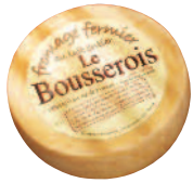
Le Bousserois 8 kg