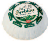
Le Brebiou 1,5 kg