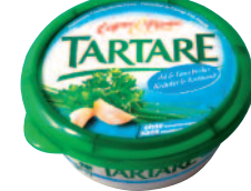
Tartare Ligne & Plaisir Ail & Fines Herbes 150 g