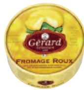
Gérard sélection Roux 125 g