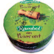
Rambol Fourré Poivre vert 2 kg