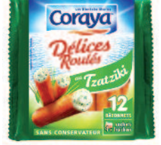
Coraya Délices Roulé Tzatziki 180 g