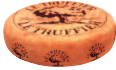
Truffier 2,6 kg