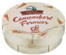
Ferme de la Tremblaye Camembert fermier 250 g