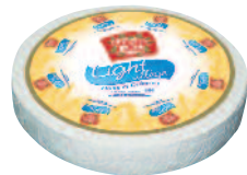
Coeur de Lion Light 2 kg