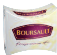
Boursault Vache 200/125 g