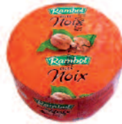
Rambol Fourré Noix 2 kg