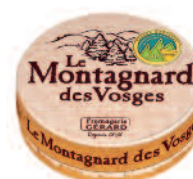
Maison Boursault Le Montagnard 200 g