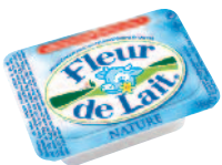
Fleur de lait Nature 16 g