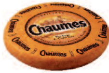
Chaumes 2 kg