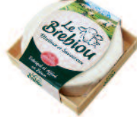
Le Brebiou 180 g