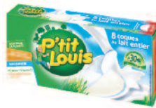
P'tit Louis Coques 160 g