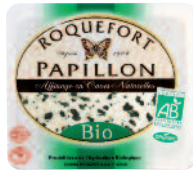
Papillon Roquefort Bio 100 g