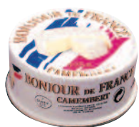
Bonjour de France Camembert 125 g