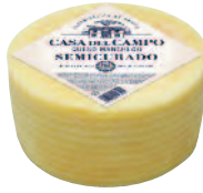
Casa Del Campo Manchego semi curado 3 kg