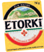
Etorki 210 g