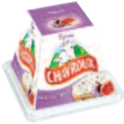
Chavroux Figues 150 g