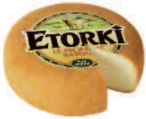
Etorki 4,4 kg