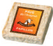
Papillon Pavé de l'Aveyron 400 g