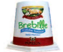
Papillon Brebille Fraîche Saveur 150 g