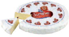
Cœur de Lion Suprême 1,8 kg