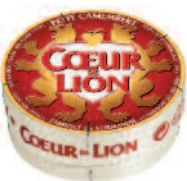
Coeur de Lion Camembert 150 g