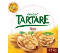
Tartare Noix 125 g