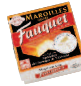
Fauquet Maroilles 200 g