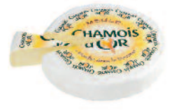
Chamois d'Or 2.4 kg