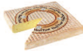
Vieux Pané 2,25 kg