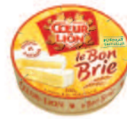
Coeur de Lion le Bon Brie 500 g