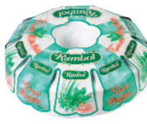
Rambol Crémeux Fines Herbes 1,8 kg