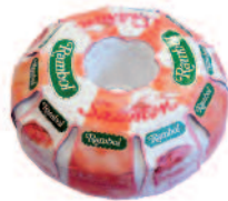
Rambol Crémeux Saumon 1,8 kg