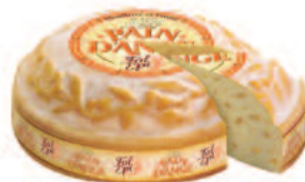
Fol Épi Pain d'Ange 2,6 kg