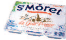
St Moret Nature 180 g