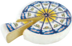
Chamois d'Or Ligne & Plaisir 2,5 kg