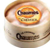
Chaumes Le Crémier 250 g