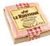
Le Rustique Typé 200 g