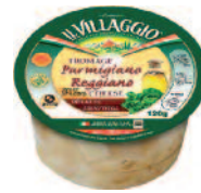
Il Villaggio Parmigiano copeau 120 g