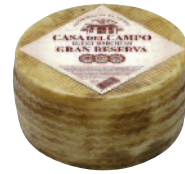
Casa del Campo Gran Reserva 3 kg