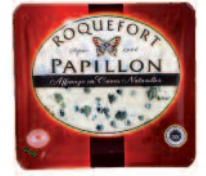
Papillon Roquefort Tranche 100 g