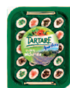
Tartare Aperifrais Provence 100 g