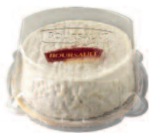
Boursault Coupe 500 g