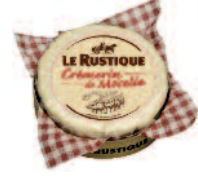
Le Rustique Crémier de Moselle 200 g