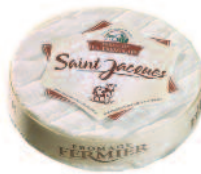
Ferme de la Tremblaye St-Jacques 400 g