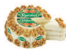
Rambol Décoré noix 1,2 kg