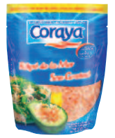
Coraya Rapé Grated 180 g