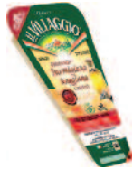
Il Villaggio Parmigiano port 170 g