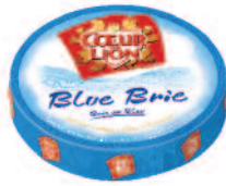
Coeur de Lion Blue Brie 2 kg