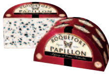
Papillon Roquefort Red 1/2 Pain 1,35 kg