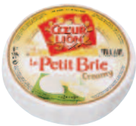
Coeur de Lion Petit Brie 500 g