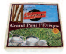
Levasseur Grand Pt l'Evêque 1,45 kg