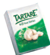
Tartare Ail & Fines Herbes 16 g