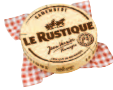
Le Rustique Camembert 250 g