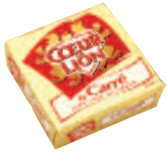
Cœur de Lion Carré 250 g