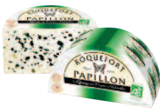
Papillon Roquefort Bio 1/2 Pain 1,38 kg