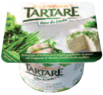
Tartare Rêve du Jardin 150 g