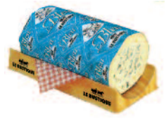
Le Rustique Le Bleu 1,8 kg