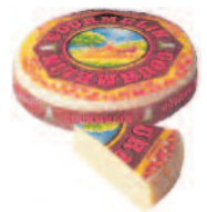
Gourmelin 1,9 kg