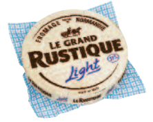
Le Rustique Léger 1 kg