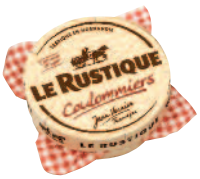
Le Rustique Coulommiers 350 g