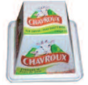
Chavroux 150 g