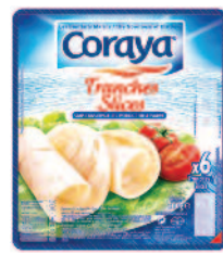
Coraya tranches slices 200 g