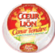
Coeur de Lion Camembert Cœur Tendre 220 g