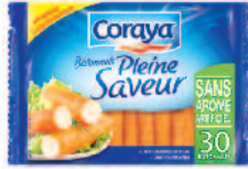
Coraya Bâtonnets pleine saveur 450 g