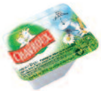
Chavroux 20 g