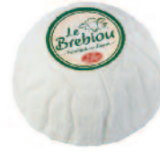
Le Brebiou Dome 150 g