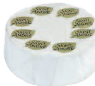
St André 2 kg