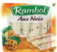
Rambol Fourré Noix 140 g