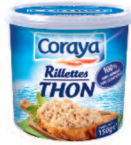
Coraya rillettes Thon 150 g