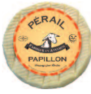
Papillon Péral 100 g