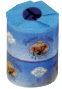
Sancy Fourme 2,1 kg