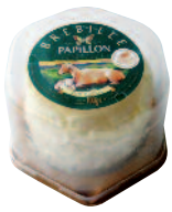
Papillon Brebille Cloche 100 g