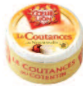
Cœur de Lion Coutances 200 g