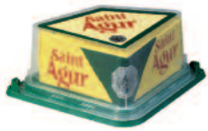
St Agur 250 g