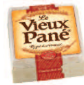
Vieux Pané 200 g