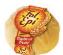
Fol Épi 200 g