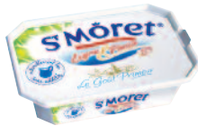
St Moret Ligne & Plaisir 150 g