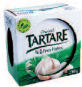
Tartare Ail & Fines Herbes 150 g