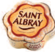
St Albray 200 g