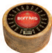
Boffard Reserva 3 kg