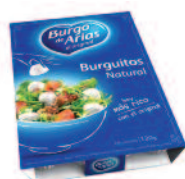
Burguitos Nature 120g