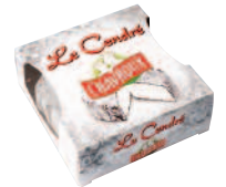
Chavroux Le Cendré 150 g