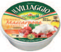
Il Villaggio Mascarpone 250 g