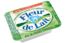
Fleur de lait Ail et fines herbes 16 g