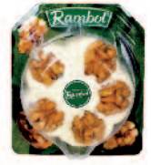
Rambol Décoré Noix 200/125 g