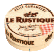
Le Rustique Petit Camembert 150 g