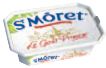
St Moret Nature 150 g