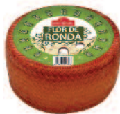
Flor de Ronda Cabra 3 kg