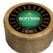
Boffard Curado 3kg