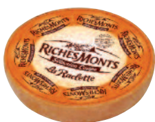
Riches Monts Raclette Ronde 6.5 kg