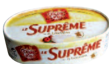
Cœur de Lion Suprême 200 g