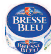
Bresse Bleu 500/250/150 g