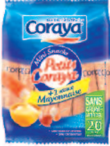
Coraya Les petits mayo 210 g