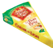
Coeur de Lion Brie pointe 200 g