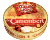
Coeur de Lion Camembert 250 g