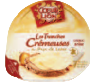
Cœur de Lion Tranche Crémeuse 150 g