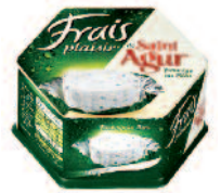
St Agur Frais Plaisir 140 g