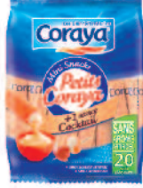
Coraya Les petits cocktail 210 g