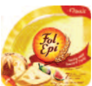
Fol Épi tranches 150 g