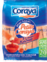
Coraya Les petits ketchup 215 g