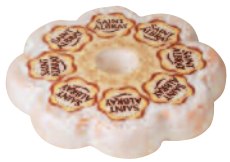
St Albray 2,1 kg