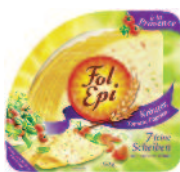
Fol Épi Provence tranches 150 g