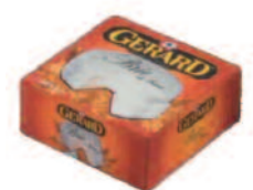
Gérard Brie 125 g