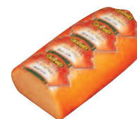
Gérard Bûche 1,9 kg