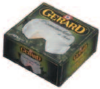
Gérard Camembert 125 g