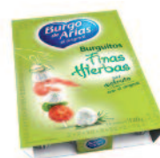
Burguitos Fines Herbas 120g