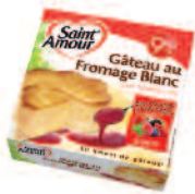
St Amour Gâteau Fromage Blanc 350 g