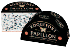
Papillon Roquefort Black 1/2 Pain 1,35 kg