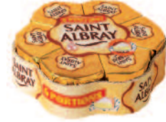
St Albray 180 g