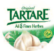
Tartare Ail & Fines Herbes 80/90 g