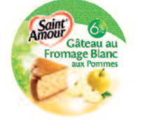
St Amour Pomme 3 kg